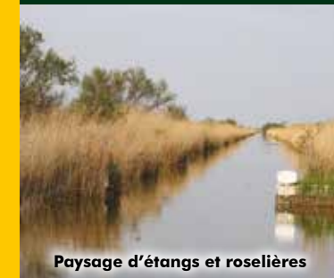
Paysage d'étangs et roselières