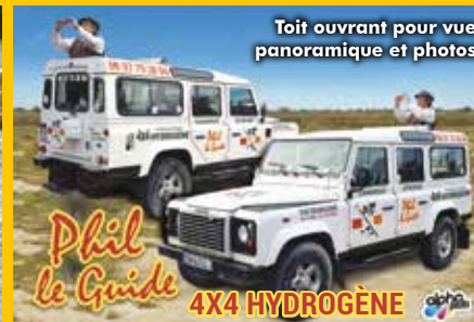
Toit ouvrant pour vue panoramique et photos