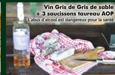
Vin Gris de Gris de sable + 3 saucissons taureau AOP

L'abus d'alcool est dangereux pour la santé