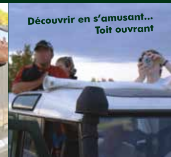
Découvrir en s'amusant... Toit ouvrant

GUIDE TERRITORIAL EN PATRIMOINE Naturel et écologique, historique et culturel, artisanal et agricole, écotouristique et gastronomique